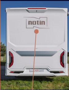
NOUVELLE FACE ARRIÈRE MONOBLOC POLYESTER