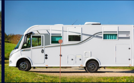
VITRES ET VOILETS ÉLECTRIQUES BREVET NOTIN